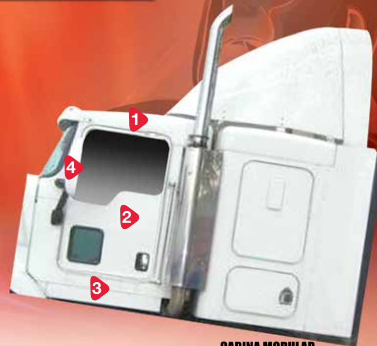
CABINA MODULAR CABINA CON CAMAROTE SEPARADO

KENWORTH ES UNA MARCA REGISTRADA DE PACCAR CORPORATION. LA FOTO ES MOSTRADA ÚNICAMENTE PARA PROPÓSITOS DE IDENTIFICACIÓN DEL MODELO.