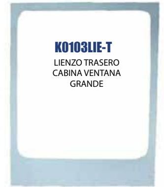
K0103LIE-T LIENZO TRASERO CABINA VENTANA GRANDE