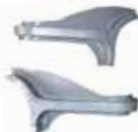
K0103RE-L K0103RE-R REFUERZOS INTERIORES DE CABINA FIBRA DE VIDRIO