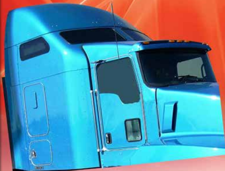
CABINA INTEGRAL CABINA CON CAMAROTE INTEGRADO