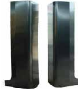
K0103LIE-L K0103LIE-R LIENZOS DE CABINA VUELTA TRASERA