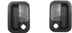
K0103BP-L-H K0103BP-R-H CHAPAS PARA PUERTA DAY LITE