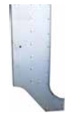
TOR0060LIE-L TOR0060LIE-R LIENZO TORPEDO CABINA T-300