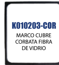
K010203-COR MARCO CUBRE CORBATA FIBRA DE VIDRIO