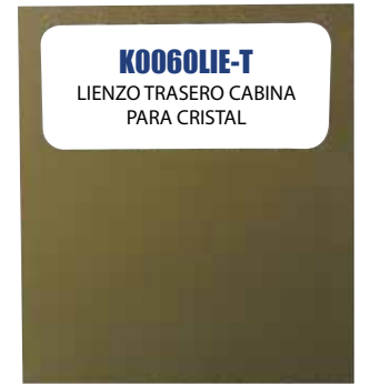
K0060LIE-T LIENZO TRASERO CABINA PARA CRISTAL