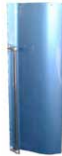
EXTENSION INFERIOR DE CABINA