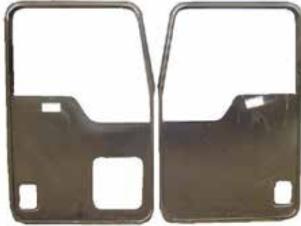
PUERTAS BOTE DAY LITE