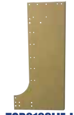
TOR0103LIE-L TOR0103LIE-R LIENZO TORPEDO CABINA T-600 / T-800