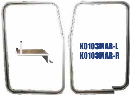
MARCOS PARA CABINA TIPO "T"