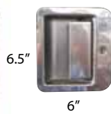
K0203BP-L K0203BP-R CHAPA GRANDE